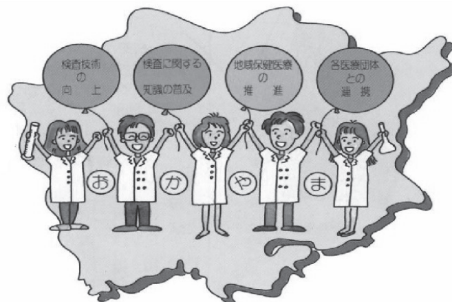
臨床検査技師会の活動

所属施設に、他に当会の会員がおられない場合は施設登録(日臨技)も併せて行ってください。施設登録用紙は、日本臨床検査技師会ホームページからダウンロードできます。