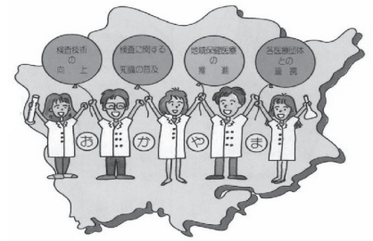
臨床検査技師会の活動